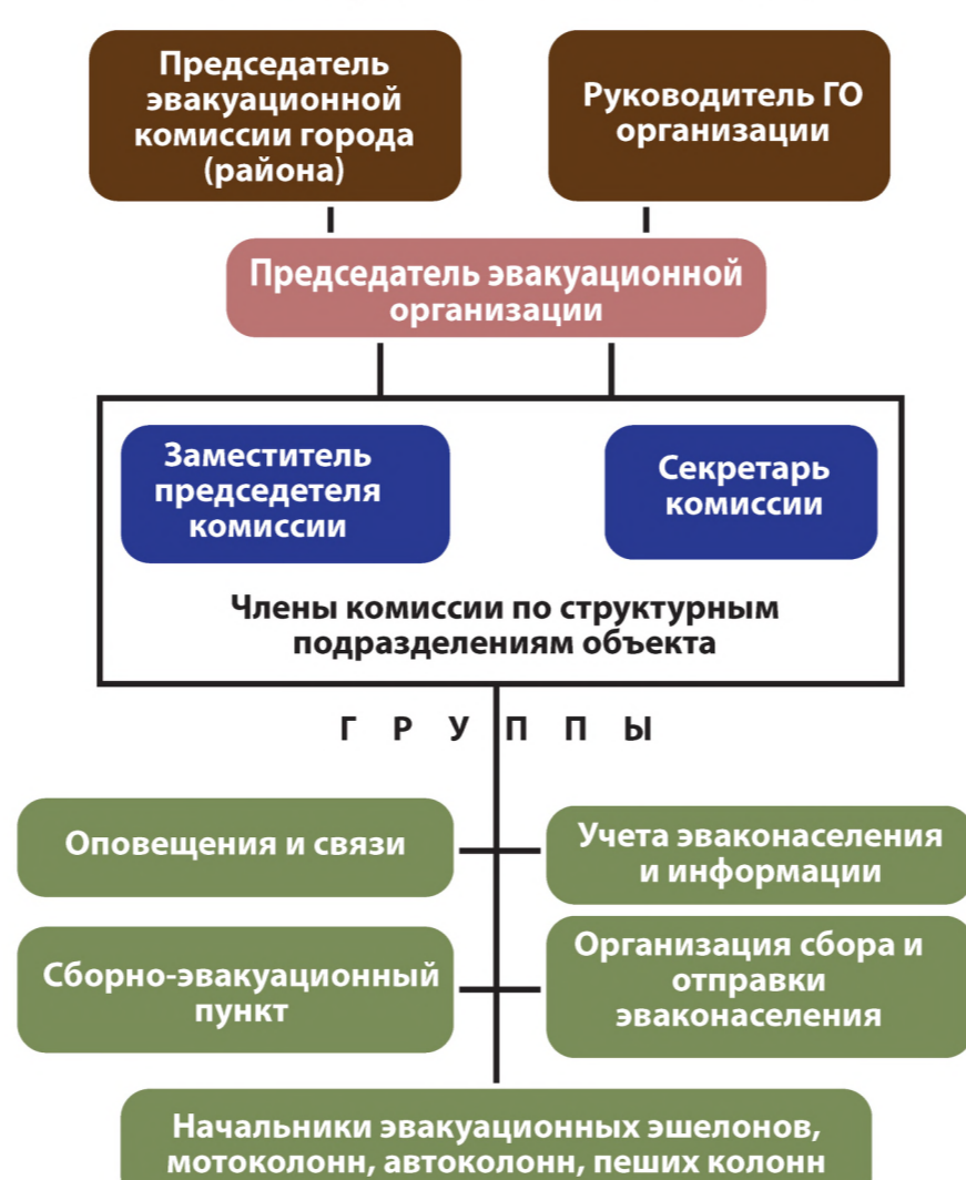
СХЕМА ОРГАНИЗАЦИИ СБОРНОГО ЭВАКУАЦИОННОГО ПУНКТА